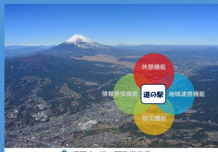
裾野市 道の駅整備事業

裾野市では、主要幹線道路沿いに道の駅整備を検討しています。基本計画の策定前に、道の駅整備における官民連携手法の導入可能性や収益向上に資する導入施設、整備手法、管理運営手法についてご意見・ご提案を募集します。