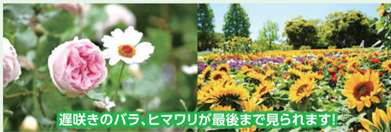
遅咲きのバラ、ヒマワリが最後まで見られます!

会期終了後の6月3日~30日は、通常開園に向けた園内整備を行うため、閉園します。そのため、浜名湖花博のために整備した庭園が見られるのもあとわずかです。遅咲きのバラやヒマワリに加え、アジサイ、マーガレット、ジニアなど、多彩な花を最後までお楽しみください。