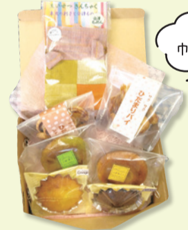
かわいい巾着袋付き!

抽選で20の方にプレゼント! むじのくに福産品 ギフトセット~焼き菓子と巾着のセット~ (医療法人社団至空会 ひだまりのみち)