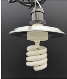
図1 照射光源 UV-B 電球形蛍光灯