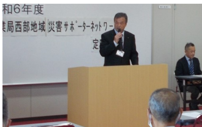
局参事からの挨拶（西部）