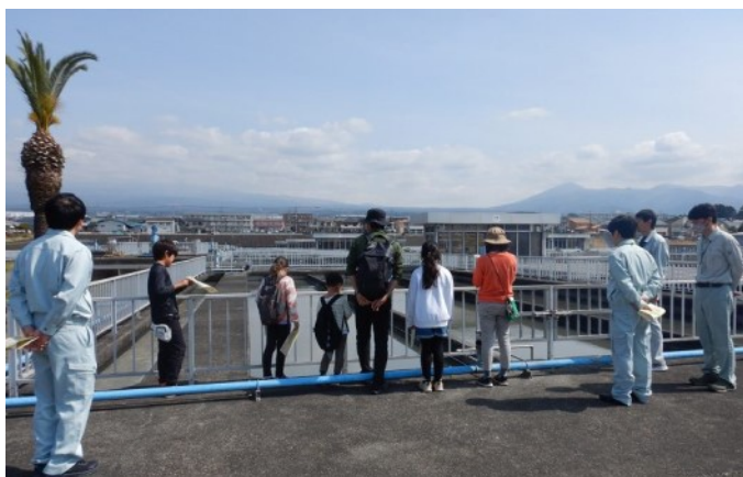
水の汚れが取れていく様子を見学！