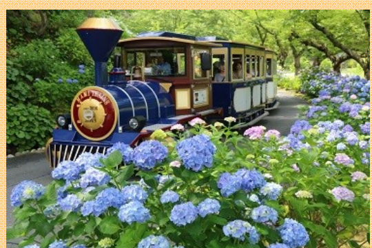
アジサイと フラワートレイン

6月は紫、青、白と潤うほど色鮮やかなアジサイ、約 70 万本のハナショウブが見頃を迎えます。さらに6月は、はままつフラワーパーク会場入場者限定で、浜松市動物園の入場料が無料になります。（※6/1～6/16）