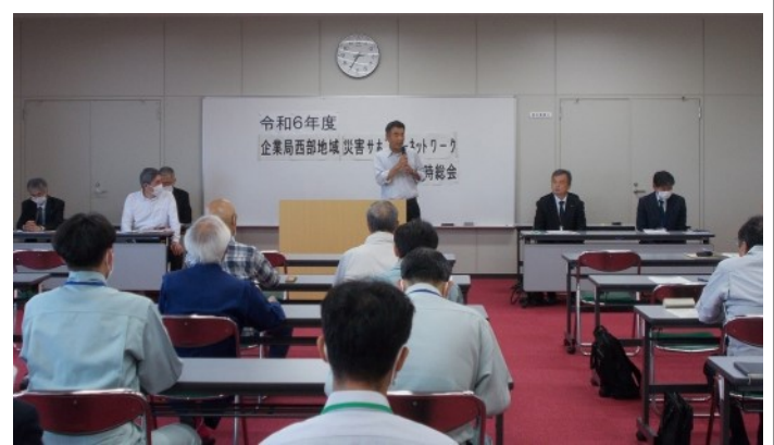
活動実績及び活動計画の報告（西部）

今後も、災害サポーターネットワークとの連携、情報共有を進め、万が一の事故等の場合にも速やかに復旧ができるよう努めてまいります。