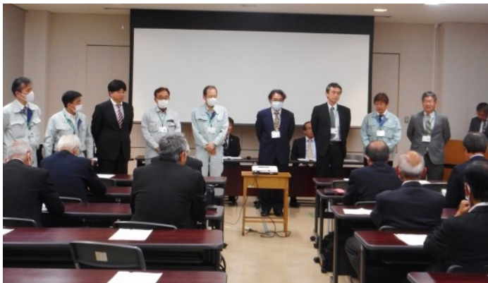
事務所幹部職員紹介（東部）

近年では、令和4年9月23日から24日にかけての台風15号の影響により、静岡市清水区の約6万3千戸で断水が発生した際、災害サポーターの方々のご協力を得て、地域住民への生活用水としての工業用水の直接支援を実施しました。そのような状況でのサポーターの支援は非常に心強いと再認識しました。