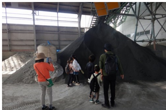
できたての脱水ケーキを見学！

※企業局では、県民の皆様にご理解を深めていただくため、施設見学を実施しています。企業様の施設見学も受け入れておりますので研修や視察などに御利用ください。