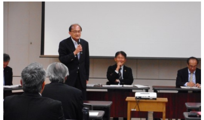
新規加入者からの挨拶（東部）