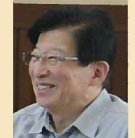
川勝 平太 静岡県知事