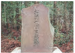
お茶つば屋敷跡(静岡市葵区井川大日峠)

1603年、幕府を江戸に開いたが、晩年駿府(静岡)に隠居して茶湯を楽しんだ。家康は静岡市安倍奥の大日峠にお茶壺屋敷を設け、名器の茶壺に安倍茶を詰めて納めさせた。