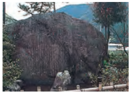
静岡茶の発祥地足久保の「狐石」(静岡市葵区足久保)

鎌倉時代の高僧で東福寺(京都)の開山。宋(中国)から帰朝のとき、茶の実と仏書千余巻を持ち帰った。茶の実の郷里に近い駿河足窪(現静岡市葵区足久保)の地に植えたといわれ、静岡茶の祖といわれる。