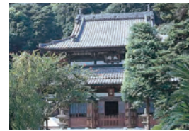
清見寺(静岡市清水区興津)

鎌倉時代の高僧、栄西禪師とともに茶業中興の祖といわれる。栄西禪師からゆずりうけた茶の実を梅尾(京都山城)に植え、さらに宇治、伊勢、駿河の清見、川越等各地に広め今日の茶産業を形成した。