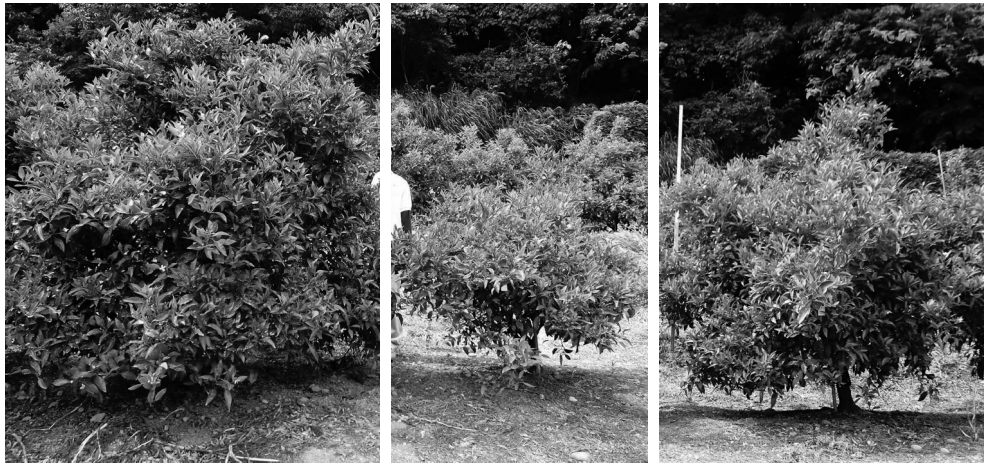
図2 各種台木を用いた‘不知火’の6年生時における樹体の様子