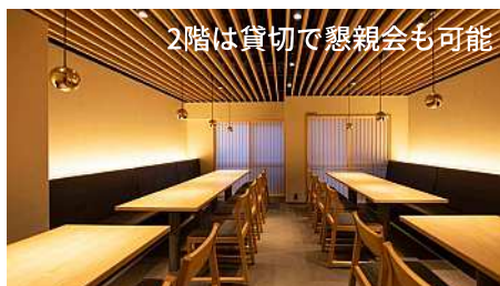
2階は貸切で懇親会も可能

住所：東京都中央区築地6-5-4 OWLビル1F 最寄駅：東京メトロ日比谷線「築地駅」 電話番号：03-6281-5987 営業時間：15:00～23:00 定休日：日曜、祝日 席数：34席