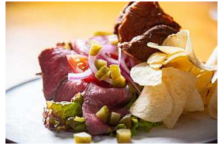
峯野牛ローストビーフのポップオーバーサンド

会場内では、浜松パワーフード学会がプロデュースするフレンチレストラン「ターブルブルーLENRI」で花を眺めながら、静岡県産食材を使用した極上の食を満喫できます。皆様のお越しをお待ちしております。