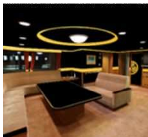
改修後の貸切特別室