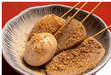
看板メニューの静岡おでん

静岡おでん以外にも、静岡県産黒はんぺんのフライや炙り、桜えびや地元牧之原市産の茶葉の天ぶら等の静岡県の季節の素材を使った料理が楽しめます。「ふるさと通信3月号を見た」と言えば、名物の黒はんぺんが静岡おでんのいずれか1品をサービスしていただけます。ぜひ一度訪れてみてください。