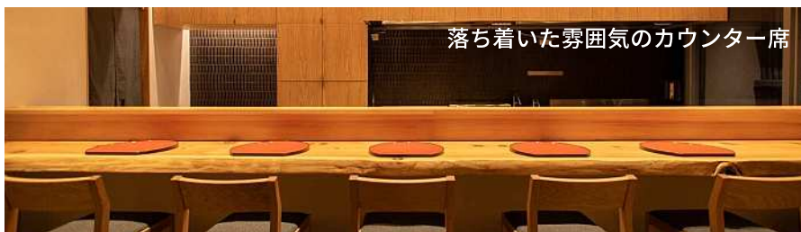
落ち着いた雰囲気のカウンター席

「しんば」は、2022年9月、築地に新店舗をオープンしました。築地店は、旧築地市場近くの閑静なオフィス街の一角に位置し、落ち着いた空間で食事とお酒を楽しむことができます。1階カウンター席のほか、2階は人数によって貸切りにするのができ、ちょっとした食事から懇親会まで幅広い用途で御利用いただけます。