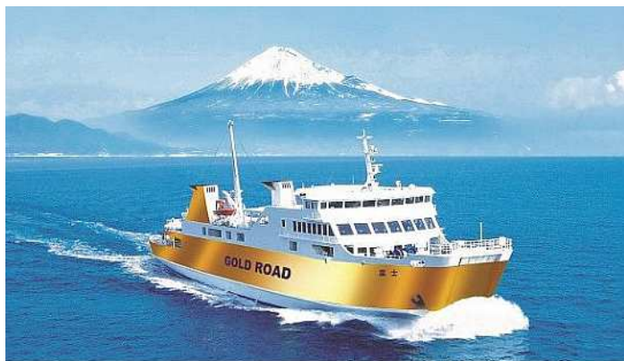
改修後のイメージ