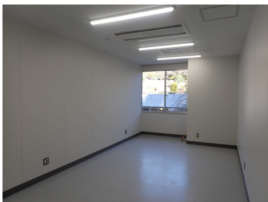
窓側 (入口から撮影)