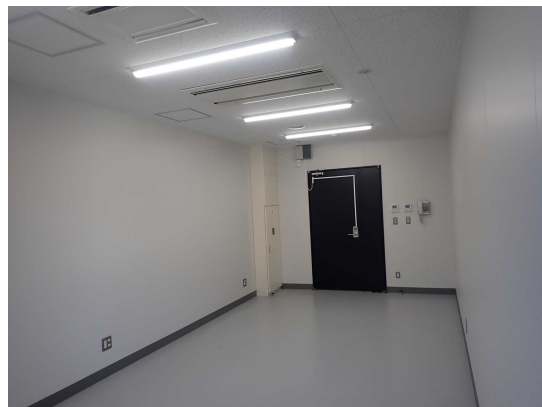
入口側 (窓側から撮影)