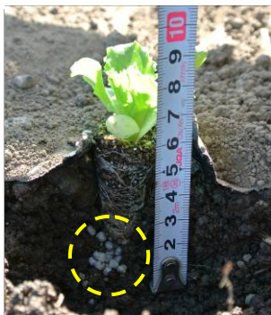
セル苗下部に粒状肥料を投入