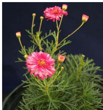
図2 「伊豆35号」の開花時の草姿