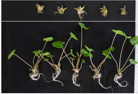
図1 6か月冷蔵終了時と順化後の二次苗