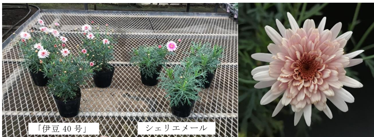
図2 現地における「伊豆40号」の開花状況(左;11月27日、三島市)と花型(右)