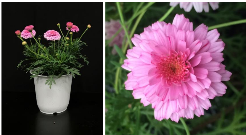
図2 現地で栽培された「伊豆45号」の草姿(左;11月27日)と花型(右)