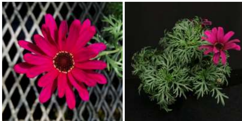
図2 「伊豆50号」の花型(左)と開花時の草姿(右)