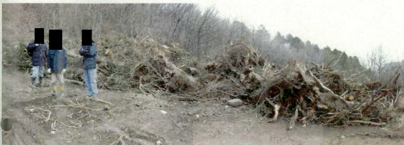
■ 上記写真より奥側に山積みされている伐採木の様子。