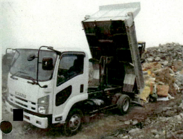
■ 現場確認中にトラックが来て積み荷を降ろし始めた。車両には“廃棄物運搬車両の表示”は見られない。