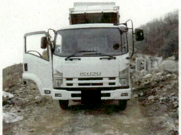
■ トラックの正面。車両ナンバーは、「[REDACTED]」。