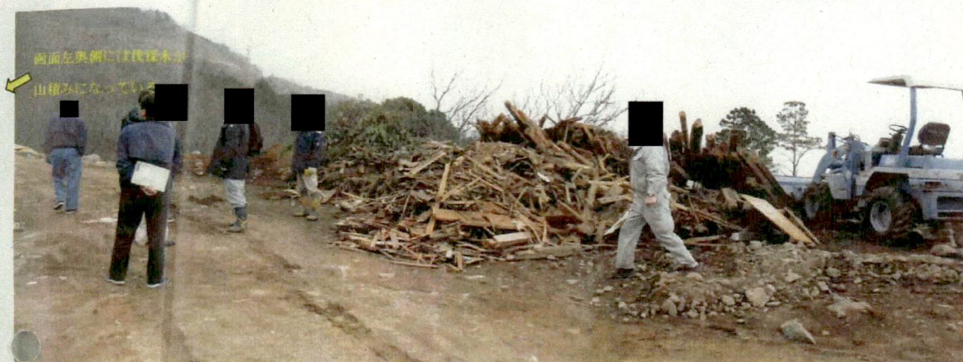
■ 前頁写真①とは別の場所に山積みされている木くずの様子。