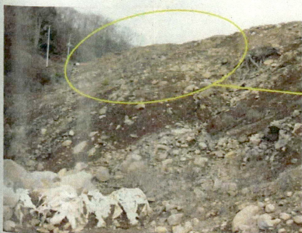
■ がれき類と繊維くずが保管されている場所の崖側部の様子。