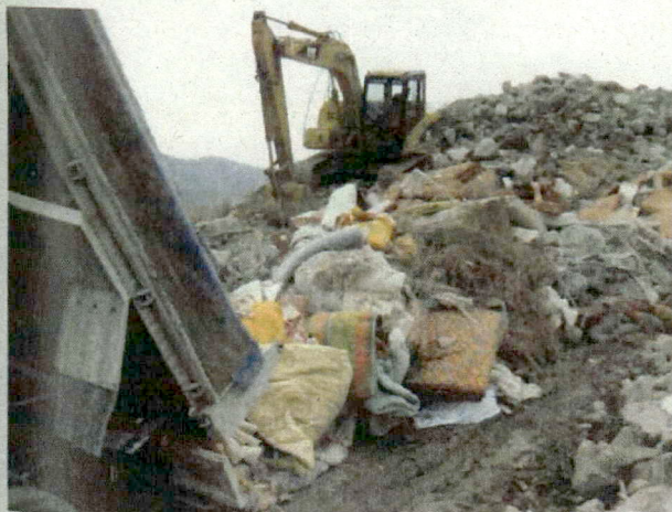
■ この時降ろした積み荷は、繊維くず（布団や毛布等）。