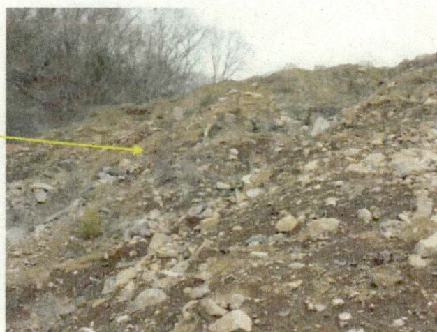
■ 左写真を拡大部分