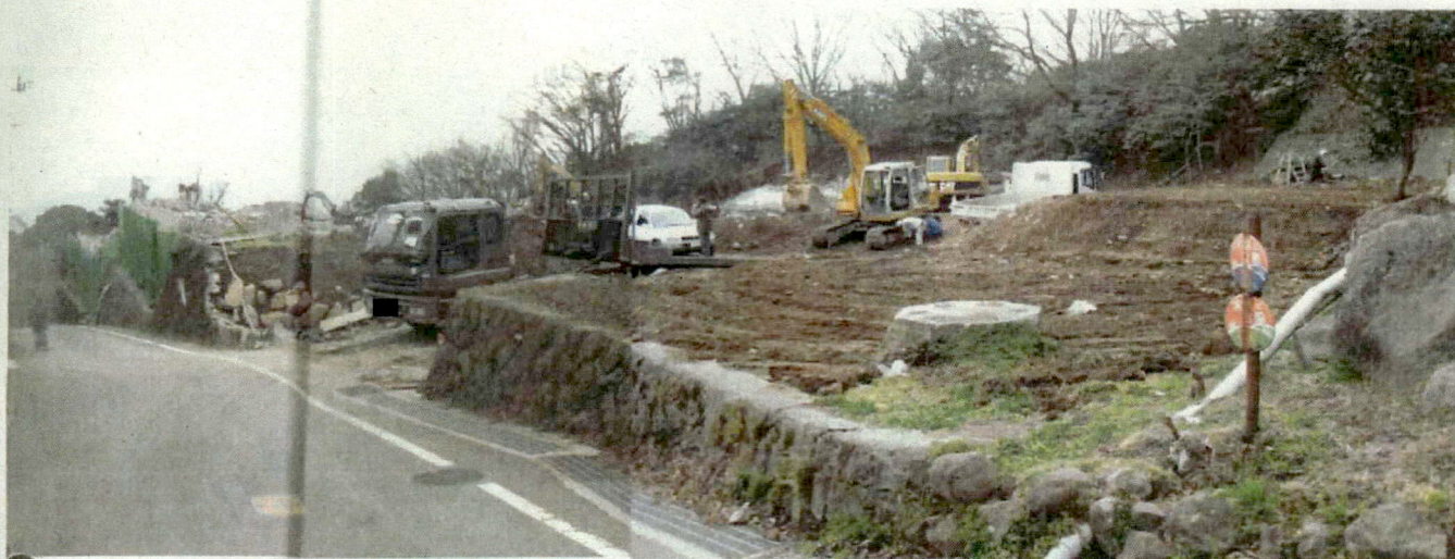
道路側から見た [redacted] 解体工事現場の様子。