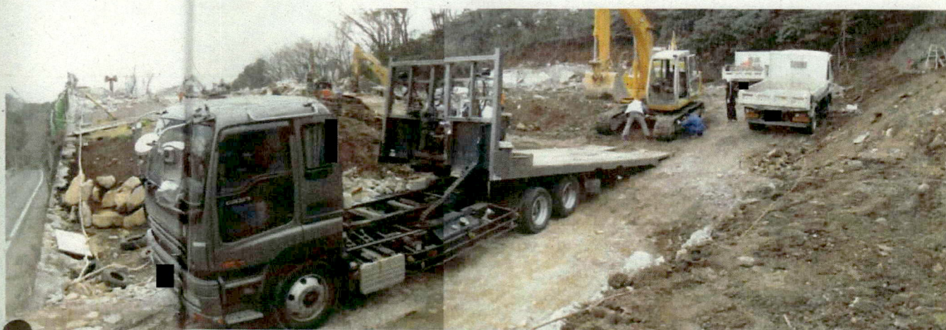
■ 道路入口側から見た解体工事現場内の全景。