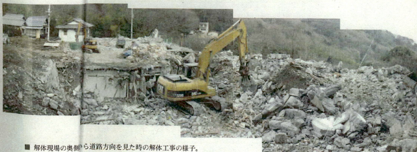
■ 解体現場の奥側から道路方向を見た時の解体工事の様子。