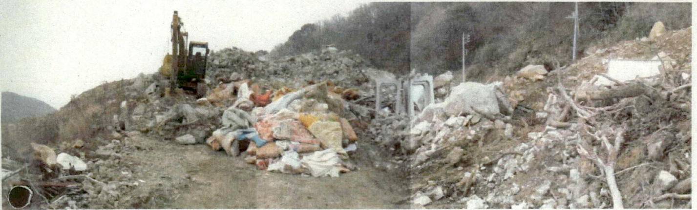
■ 熱海市伊豆山分譲地内の一角にがれき類や金属くず、コンクリート、木くず、廃プラ及び繊維くず（布団、毛布類）が不適正に保管されている。