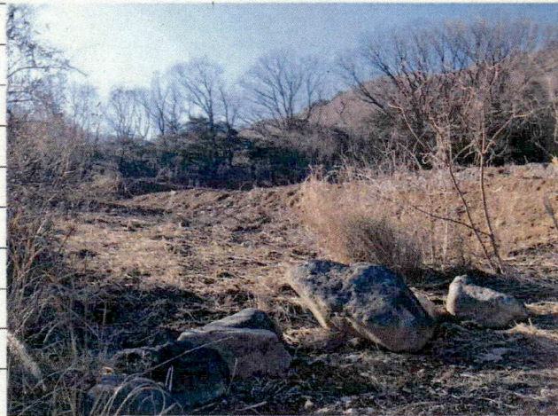
⑥ [REDACTED] (熱海市日金町)