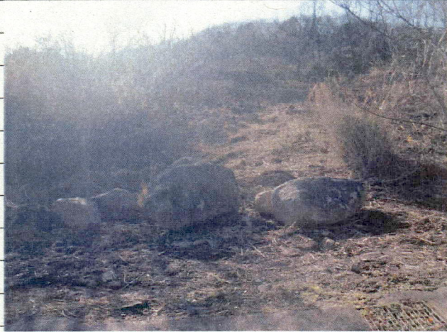
④ [REDACTED] (熱海市日金町)