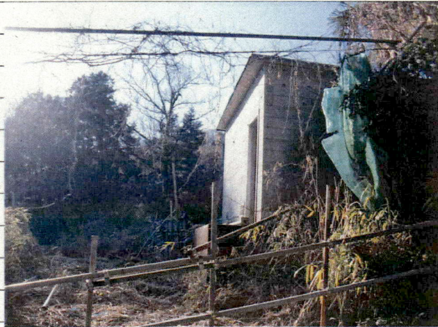
⑤ [REDACTED] (熱海市日金町)