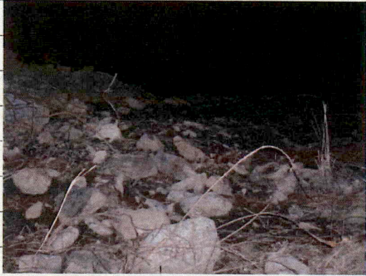
② [Redacted] (熱海市日金町)