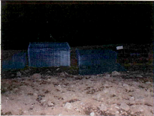
③ [Redacted] (熱海市日金町)