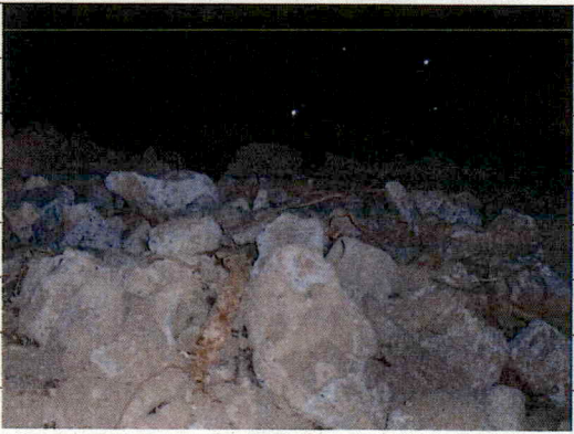
④ [Redacted] (熱海市日金町)