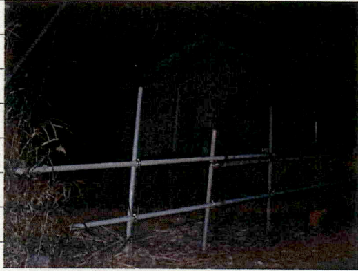
① [Redacted] (熱海市日金町)