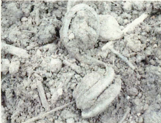
木くずの土の中に入っているもの 廃プラ様の丸いもの