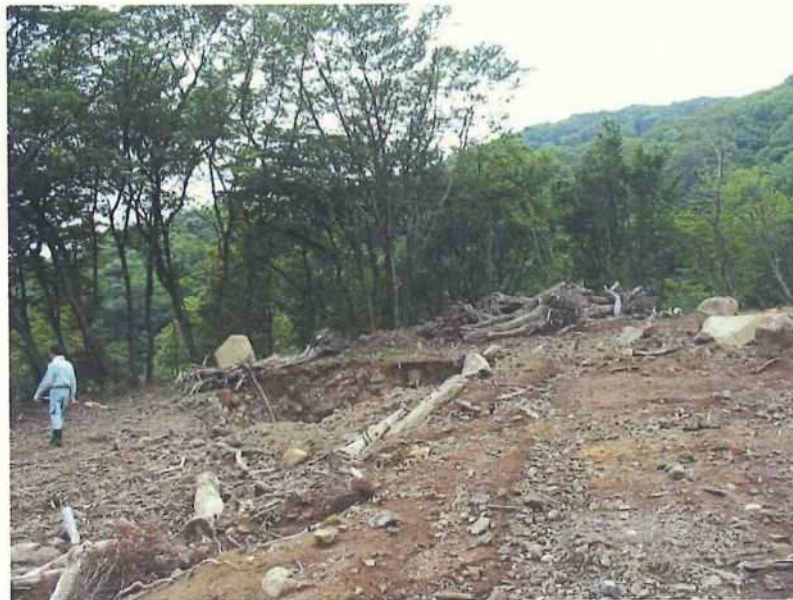
⑦ 崩壊箇所 上部より