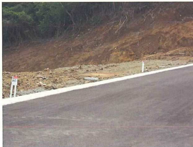
⑪ 許可済み地 現況(a)