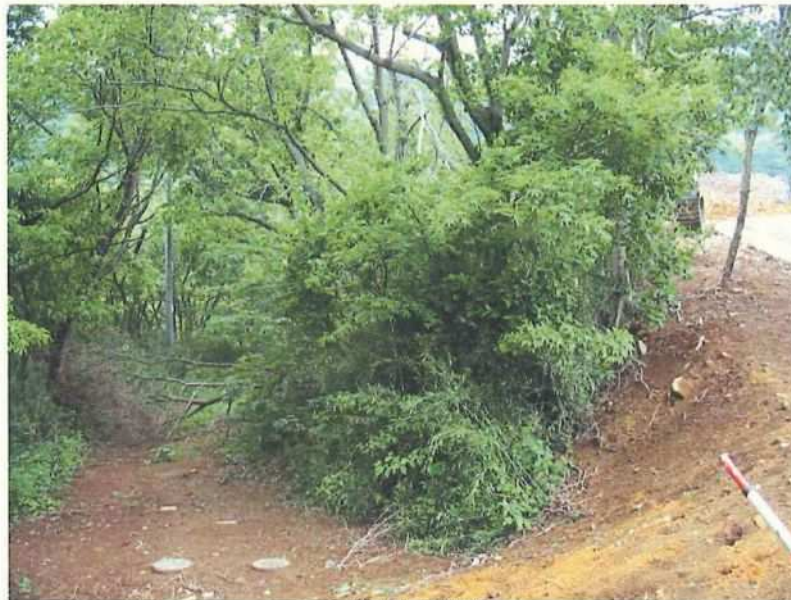
① 許可済み箇所 遠景