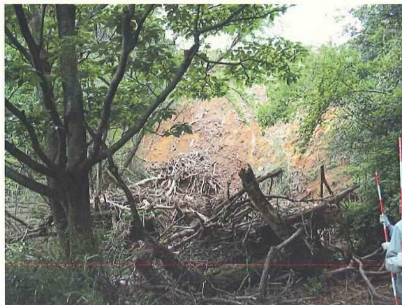
② 崩壊箇所への入口部分