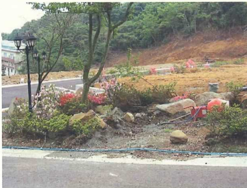
⑩ 無許可造成地 造成境界付近