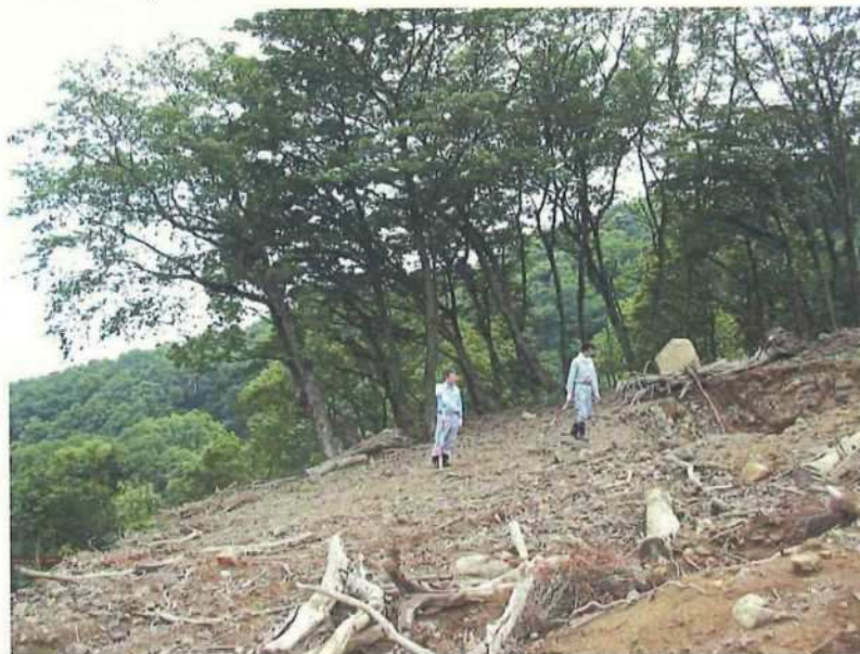
⑧ 崩壊箇所 上部の盤(a)