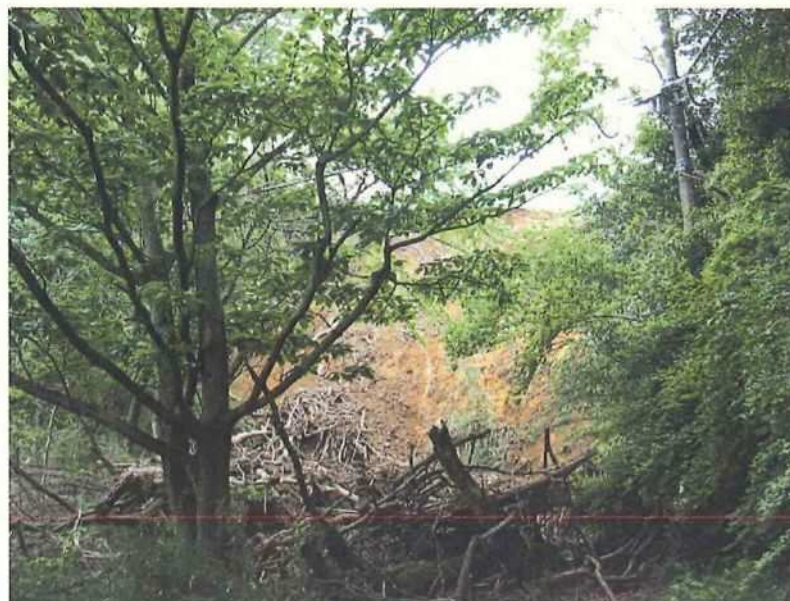
⑤ 崩壊箇所上空 電線と樹木