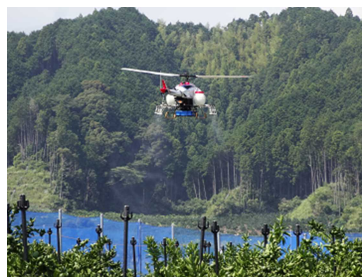
図1 無人ヘリコプター

無人航空機では農薬の濃厚少量散布を行うことから、効果や安全性が確保できる農薬の選抜も行い、農薬登録も進めていきます。併せて効果とコストについての検証も進めてまいります。