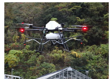
図2 マルチローター