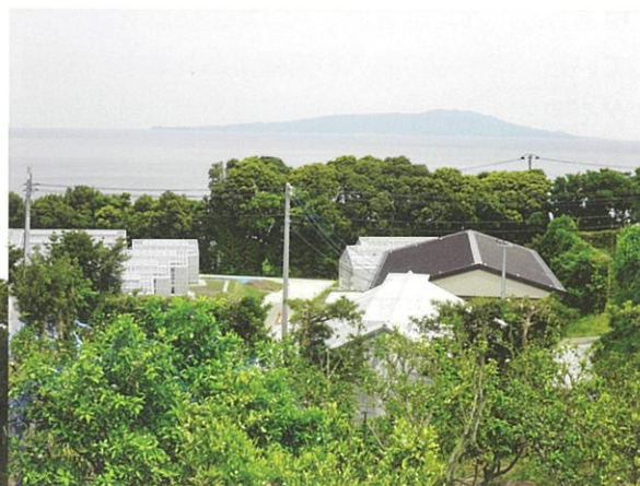
移設、新設されたハウス群 (防風樹ごしに見えるのは伊豆大島)