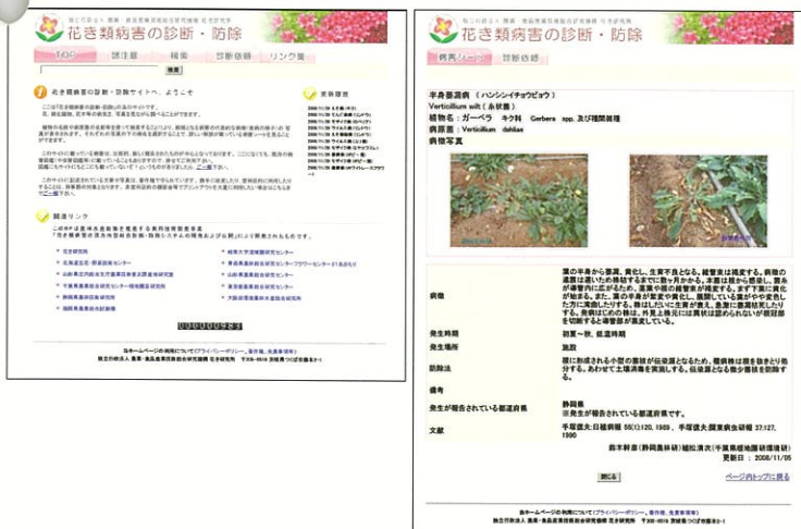
図1 公開データベース「花病害図鑑」 (左) トップページ (右) 病害シート(例)

花き類や病害の中には、この図鑑にまだ記載していないものもあります。今後も、順次追補し図鑑をさらに充実させていく予定です。