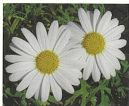
サンデーリップル

平成 18 年 5 月に育成品種 ‘サンデーリップル’ にハナワギクの花粉を交配し、胚珠培養により作った苗を、平成 19 年 5 月に伊豆農業研究センター南伊豆圃場に植えて選抜しました。これらの苗から、ラベンダーに似た芳香性を示す系統を選抜しました。この系統は、‘風恋香’（ふうれんか）の品種名で平成 21 年 3 月に品種登録を出願し、平成 21 年 5 月 28 日に品種登録出願が公表されました。