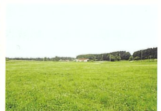
多くの行動ができるとされ家族全員で楽しめる牧場景観