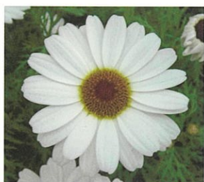
香りのマーガレット ‘風恋香’