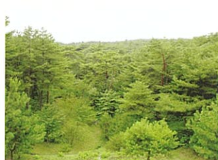
自然的で男性や子供に好まれる森林景観