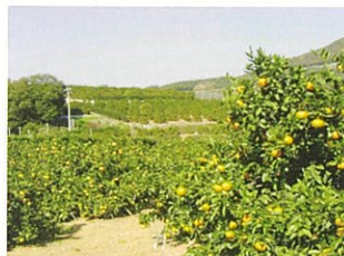
女性や子供に好まれる ミカン園景観

観を好み、特に飲食をしたくなる景観を好みました。小学生を対象とした景観活用には、飲食を含めた多くの体験活動が可能となるように配慮することが望まれます。