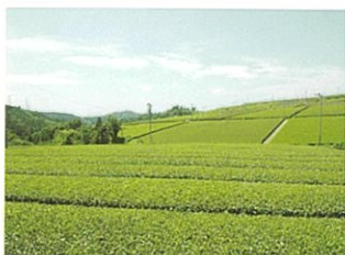
広々して女性に好まれる 茶園景観

景観とそれを好む対象の組み合わせは、茶園は女性、ミカン園は成人女性と小学生、森林は成人男性と小学生が適すと考えられました。また、成人女性は広々とした印象の景観を、成人男性は自然的な印象の景観を好むため、活動場所の選定など配慮が必要と考えられます。