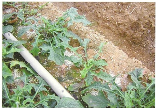
写真1 ガーベラで発生した立枯性新病害 上：ガーベラ茎腐病 Rhizoctonia solani 下：ガーベラピシウム根腐病 Pythium helicoides