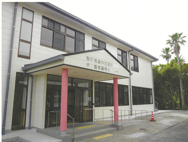
伊豆農業研究センター新庁舎