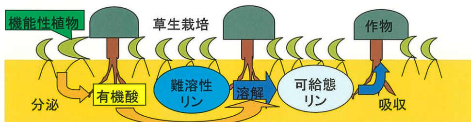
根からの有機酸を分泌することにより、難溶性リンを溶解する機能性植物

果樹研究センターでは、プロジェクト研究「リンの施肥量を激減させる資源循環技術の開発」を、平成 21 年度より 3 年間実施します。この研究では、土壌等に蓄積しているリン資源を循環利用するための技術開発を行います。具体的には、分解しやすい有機物の施用により土壌微生物の機能を向上させ、リンの吸収を促進する方法や、難溶性リンを溶解する機能性植物の利用方法を検討します。また、佐鳴湖等の富栄養化した水域から水中のリンを回収して土壌改良資材として利用する簡易な手法も開発します。これらの技術開発により、リンの施肥量が大幅に削減され、リン鉱石を原料とするリン酸質肥料が不要となる事が期待されます。