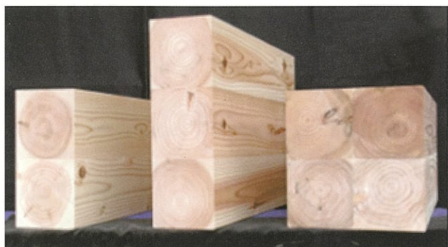
写真1 スギ間伐材による各種接着重ね梁

接着重ね梁は、間伐材等を製材・乾燥した心持ちの角材を積層接着した建築材料です。木造住宅の梁桁等や大規模木造建築の構造部材として利用でき、集成材と比べて接着剤の使用が少ないため、無垢の製材品に近い質感があります。また、製材工場でも圧縮プレス機を導入することで製造が可能です。(写真1)