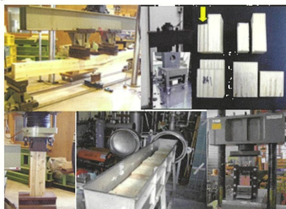
写真2 強度試験と接着試験の様子

4 接着重ね梁の接着性能と強度性能との関連性を的確に評価する手法として、接着試験後の試片を用いた実大ブロックせん断試験が有効であることが分かりました。