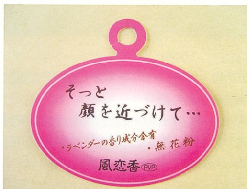
‘風恋香’の販促タグ