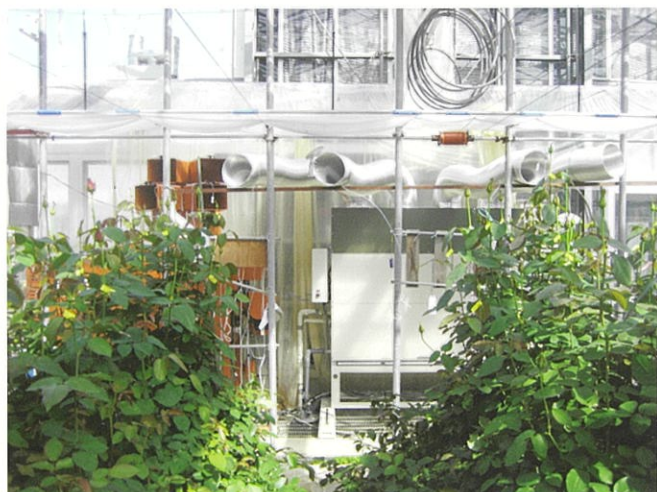
写真1 バラ園に導入されたヒートポンプ

この重油価格の高騰対策の一つとして、2006年12月から県内のバラ栽培農家に、ヒートポンプが導入され始めました。ヒートポンプは、暖房費が削減できるだけでなく、冷房もできることが大きな特徴です。ヒートポンプの暖房費削減効果と、夏季の夜間冷房によるバラの日持ち向上について検討しました。