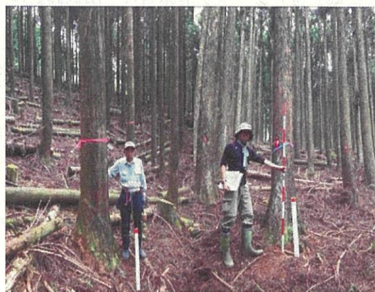
スギエリートツリー