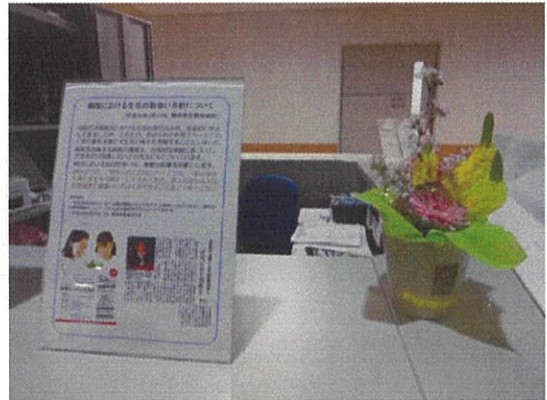
静岡市立静岡病院での展示

今後、試験展示を続けていく中で、病院ならではの課題を洗い出し、「メンテナンスフリー切り花」が病院に再び花をもたらす存在となるよう検討を重ねていきます。