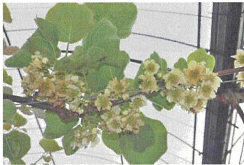
育成雄品種「にじ太郎」