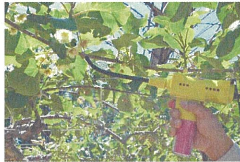
使用花粉量の削減に有効な充電式花粉交配器による受粉