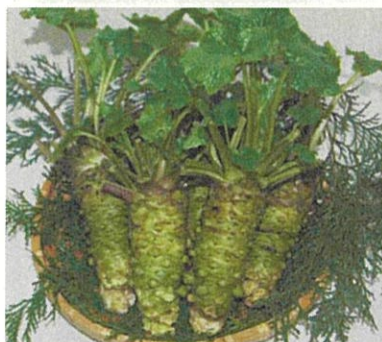
ワサビ新品種「伊づま」

このようなことから、伊豆農業研究センターでは、地域特産物の振興と観光利用農産物の開発を目指し、研究に取り組んでいます。地域特産物としては、カーネーション、マーガレット、ニューサマーオレンジ、ワサビにおいて新品種育成や新たな栽培技術の開発を進めています。また、観光利用農産物としては、カワヅザクラや賀茂十一野菜などを中心に自生植物などの栽培利用を検討しています。また、日頃からJA、市町、観光協会などの関係機関と連携を図り、成果の普及に努めています。