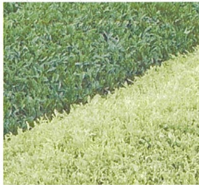
【遮光の程度と葉色の違い】

高級茶で知られる玉露やかぶせ茶は、新芽の生育期に適度に遮光することで濃緑色でアミノ酸を多く含むお茶になりますが、白葉茶はほぼ完全に遮光（強遮光）することで葉緑素が逆に低下して新芽が黄白色に変化し、アミノ酸含量がさらに多いお茶になります。