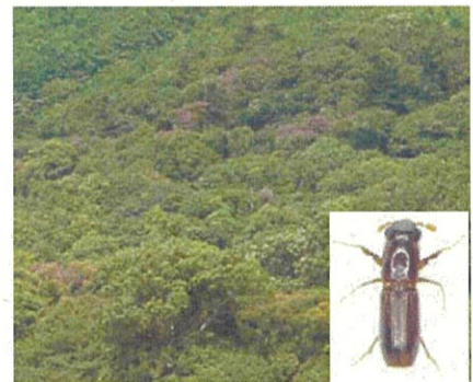
浜松市北区の被害とカシノナガキクイムシ