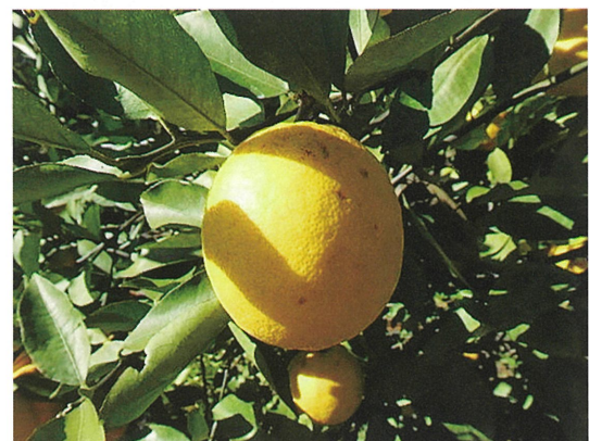
写真1 レモネードの果実

レモネード(写真1)は、昭和47年にニュージラランドから伊豆地域に導入されたカンキツです。果形や果皮色などの外観がレモンに似るため、レモンの類縁種といわれていますが、レモンのような強い酸味がなく、生果をそのまま食べることができません。また、手で皮を剥くことができ、種子は少なく、特有の豊かな香りを持つていることから有望です。耐寒性は弱いといわれており、無加温ハウスでの栽培をお勧めしていますが、県内では露地での栽培も行われております。露地栽培での収穫期は2〜3月で、この時期になると酸含量は1〜2%程度となり、レモンに似た外観で食味がよいという意外性から人気が高まっています。