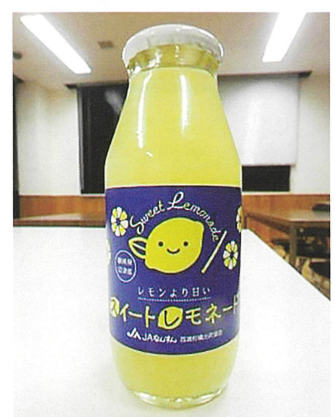
写真2 果汁入り飲料

昭和51年以降に実施した当センターの特性調査を経て、現在ではJAなんすん管内に導入されています。温州みかんと収穫期が重ならず、作業労力の分散が図れる点からも注目されて産地化が進んでいます。また産地では、生果の販売だけでなく、果汁入り飲料(写真2)など、レモネードの豊かな香りを活かした加工品の開発が行われているため、レモネードに含まれる香りの特性や、レモンとの違いを明らかにすることで、香りを活かした更なる加工品の開発につながると考えられます。そこで、当センターにおいて、レモネードの果汁に含まれる揮発性成分の組成とその香気特性について検証したので、その結果を紹介いたします。