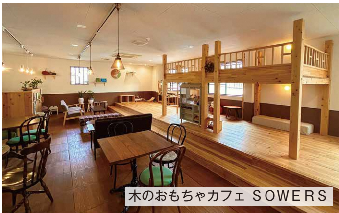
木のおもちゃカフェ SOWERS