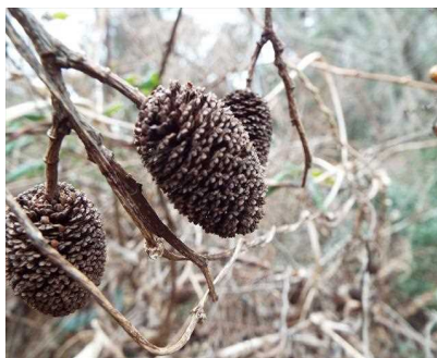
□ ヤシャブシの実 ☆