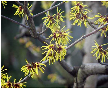
□ マンサク ☆☆