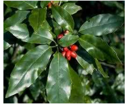
□ アオキ ☆☆