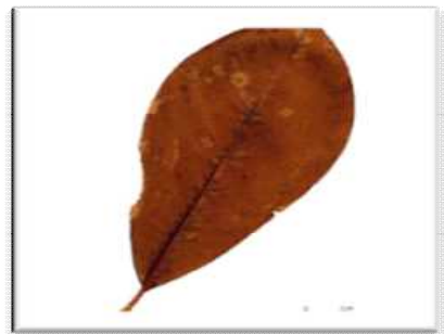
□ ホオノキの大きな葉 ☆