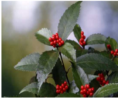
□ センリョウ ☆☆