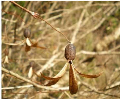
□ ツクバネの実 ☆☆☆