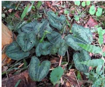
□ カンアオイ ☆☆