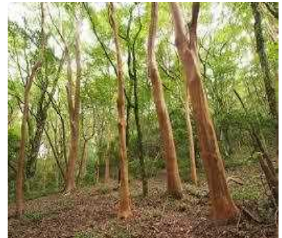
□ ヒメシヤラの木肌 (オレンジ色) ☆☆