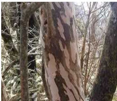
□ リョウブの木肌 (まだら模様) ☆☆