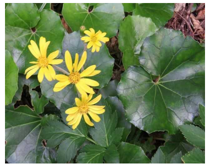
□ ツワブキ ☆☆