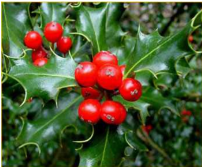
セイヨウヒイラギ