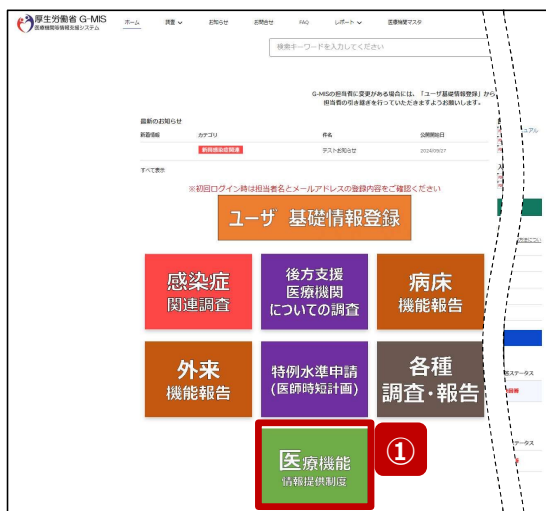
ホーム画面 (病院等)