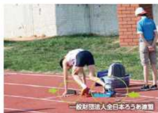
ランプの光でスタートを知らせる