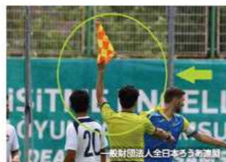
審判の合図は笛だけではなく旗も