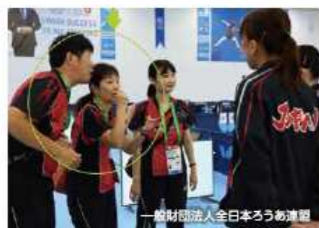
手話言語通訳でコミュニケーション