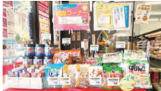
▲店舗入口に設けた減塩商品コーナー

高血圧の改善に向け、1市5町で血圧計設置場所の見える化や減塩ポップの掲示など、地域を挙げた対策を実施。松崎町や河津町では、スーパーと連携したイベントや減塩商品コーナーの設置に取り組んでいます。