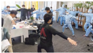
▲オリジナル体操で活力アップ!

社員の健康度を上げるために、血圧測定セミナーを行い毎日2回の測定を2カ月間行いました。また、社員が楽しみながら運動不足を解消できる独自の健康体操を考案し実践しています。