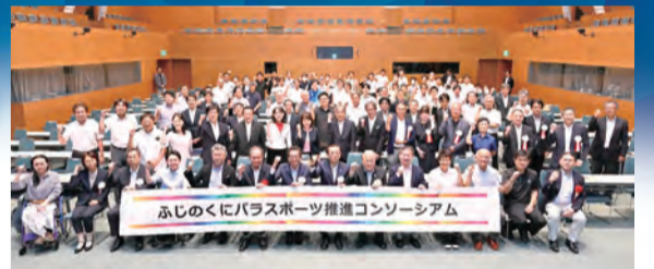
▲8月30日に行われた設立総会を機に活動がスタート

スポーツの秋が到来。県は誰もが生き生きと健康に暮らせる共生社会を目指して、官民が連携してパラスポーツの振興に取り組む「ふじのくにパラスポーツ推進コンソーシアム」を設立しました。パラスポーツには障害の有無にかかわらず誰もが取り組めるなどさまざまな魅力があります。みんなで観戦したり、一緒に楽しんだりしてみませんか?