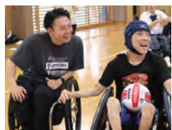
▲車いすラグビー用ボールで楽しむ若山選手(左)と生徒

東京2020パラリンピック競技大会の車いすラグビーで二大会連続の銅メダルに輝いた若山英史選手(沼津市出身)が県障害者スポーツ応援隊として、県立東部特別支援学校(伊豆の国市)を訪れ、出前講座を行いました。