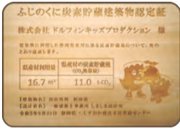
▲県産材を使った認定証