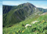
◀南アルプスの 稜線のお花畑

令和2年4月に国土交通省が設置した有識者会議では、第1回から第13回まで、大井川の水資源問題について議論し、中間報告が取りまとめられました。