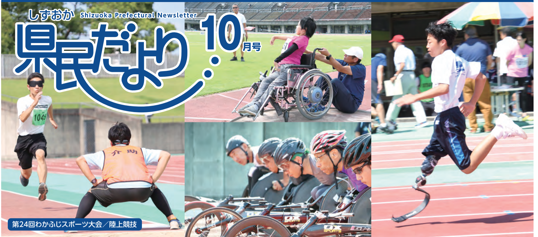
第24回わかふじスポーツ大会/陸上競技