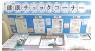
▲目で見えて楽しく健康を意識

病気になる前からの“予防”に注力。定期健康診断の受診率は100%。禁煙デーや健康チェックコーナーの設置、全従業員のストレスチェックなどにより、傷病・休職日数が大幅に減少。生産性や品質が向上しました!