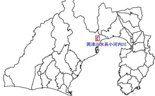
興津川水系小河内川