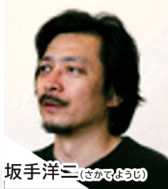
坂手 洋三 (さかて ようじ)

劇作家、演出家。劇団「燐光群」主宰。岡山県出身。岸田國士戯曲賞、鶴屋南北戯曲賞、読売文学賞、紀伊國屋演劇賞、朝日舞台芸術賞、読売演劇大賞最優秀演出家賞などを受賞。