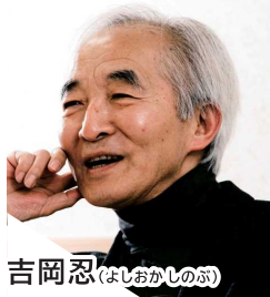
吉岡 忍 (よしおかしのぶ)

作家/長野県出身。1986年『墜落の夏一日航123便事故全記録』で講談社ノンフィクション賞受賞。日本バンククラブ前会長。