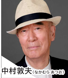
中村 敦夫 (なかむら あつお)

1940年、新聞記者の長男として東京に生まれ、戦時中は福島に疎開。俳優、作家、監督、脚本家、元参議院議員。日本バンククラブ理事。