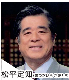
松平 定知 (まつだいら きたとも)

NHKアナウンサーを退職後、地域作りと言葉教育を組み合わせた活動を続けている。放送文化基金賞など受賞。