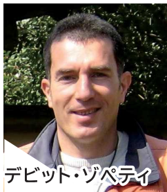
デビット・ツパテイ

スイス生まれ。高校時代から独学で日本語を学び、1986年から日本在住。同志社大学卒。1996年、『いちげんさん』ですばる文学賞を受賞、芥川賞候補となる。同作品は映画化される。日本語で執筆を続けながらリフレクソロジストとしても活動中。