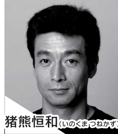
猪熊 恒和 (いのくま かねかず)

1940年、新聞記者の長男として東京に生まれ、戦時中は福島に疎開。俳優、作家、監督、脚本家、元参議院議員。日本バンククラブ理事。