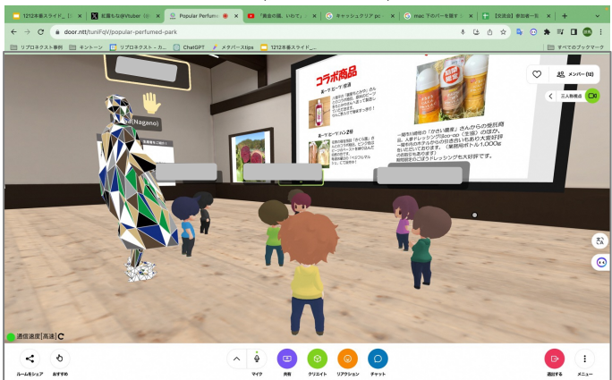
▲ 複数人が集まる様子（食の商談会）