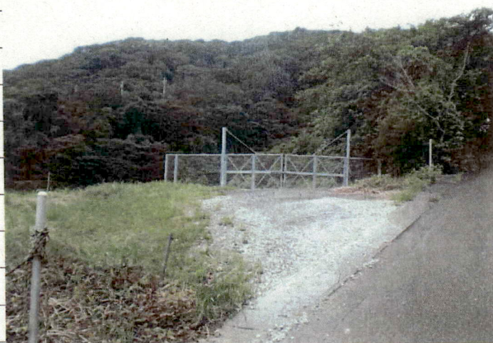
① [Redacted] (熱海市伊豆山赤井谷残土処分場)