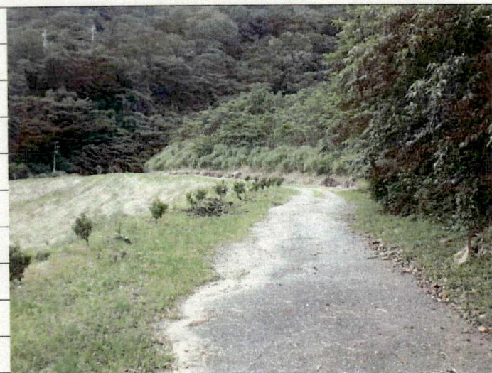
② [Redacted] (熱海市伊豆山赤井谷残土処分場)