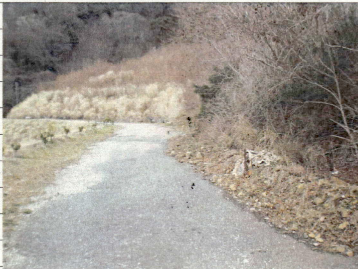
② [Redacted] (熱海市伊豆山赤井谷残土処分場)