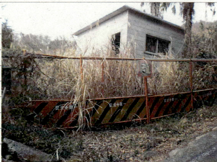
③ [Redacted] (熱海市日金町)