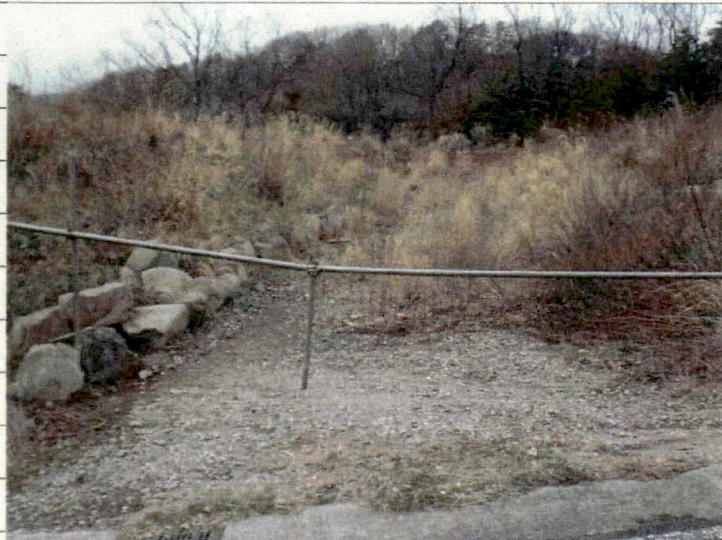
① [Redacted] (熱海市日金町)