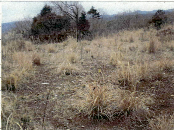
② [Redacted] (熱海市日金町)