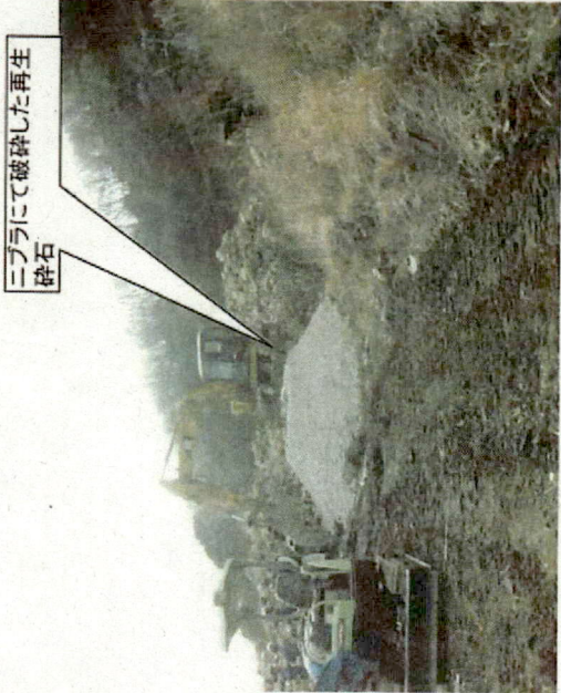
ニブラにて破砕した再生 砕石