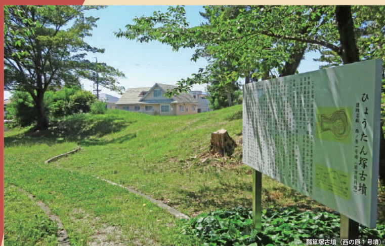
瓢箪塚古墳(西の原1号墳)