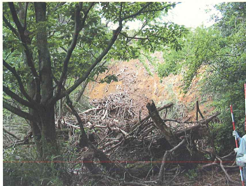
② 崩壊箇所への入口部分