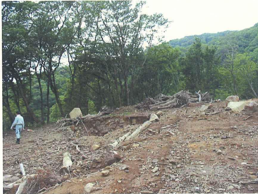
⑦ 崩壊箇所 上部より