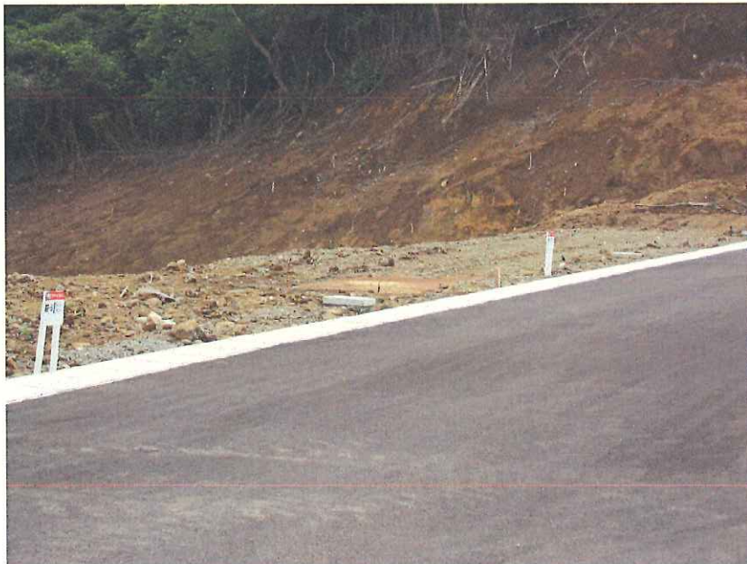
⑪ 許可済み地 現況(a)