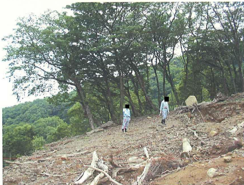
⑧ 崩壊箇所 上部の盤(a)