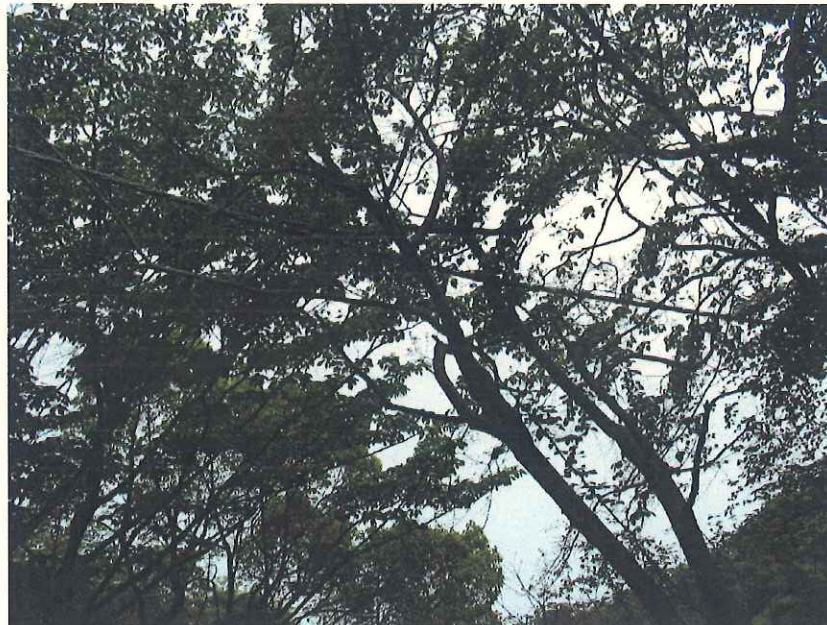
④ 崩壊箇所先の水道施設への道