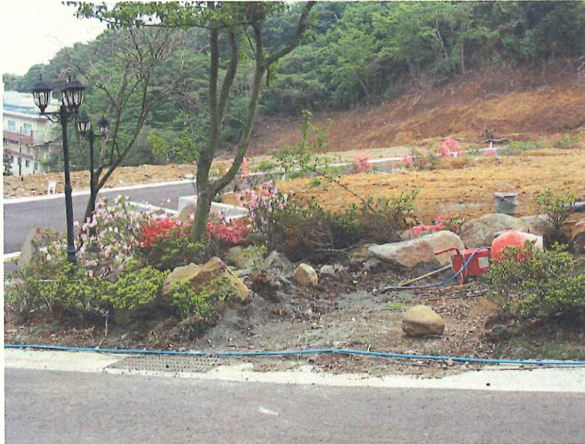
⑩ 無許可造成地 造成境界付近