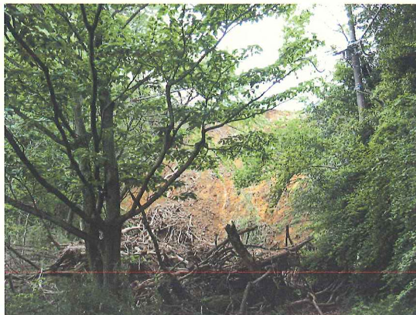
⑤ 崩壊箇所上空 電線と樹木