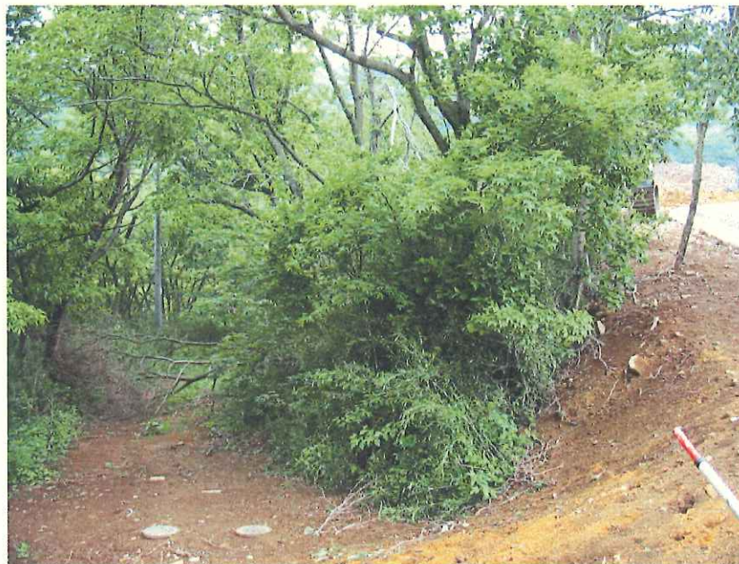
① 許可済み箇所 遠景