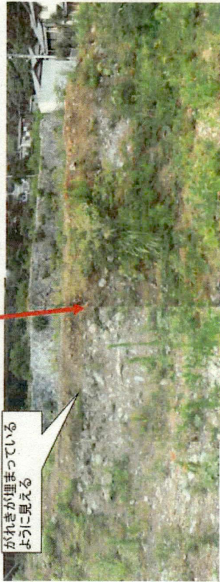
日金町不適正現場