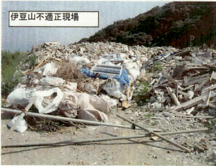
伊豆山不適正現場