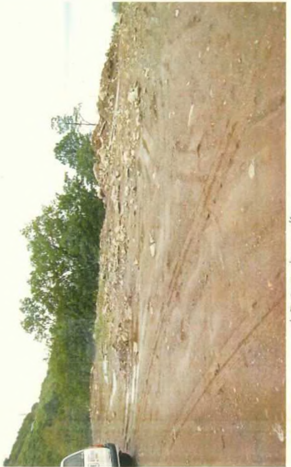
不遊層解体廃石撤去