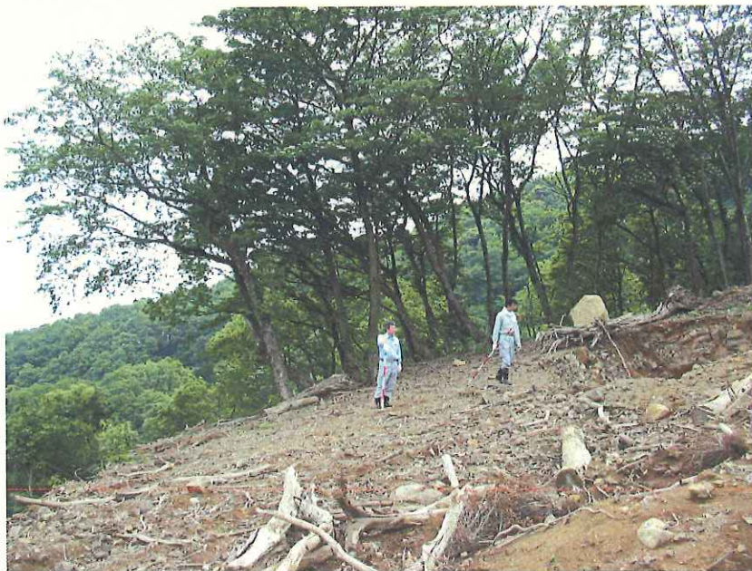
⑧ 崩壊箇所 上部の盤(a)