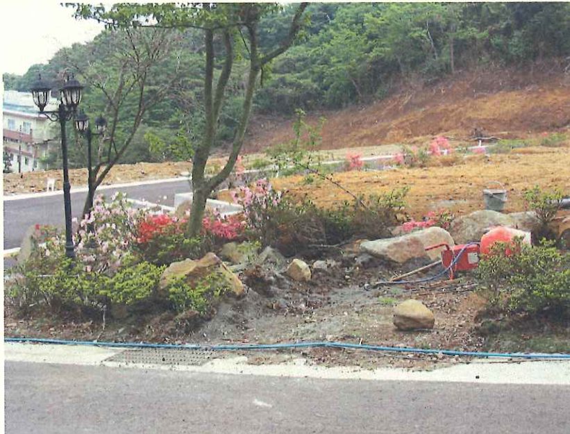
⑩ 無許可造成地 造成境界付近