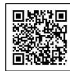
静岡県総合計画 後期アクションプラン

東京でしかできないと思っていたもの・こと、静岡県で実現する時代に! いま静岡県は、若い世代が将来のびのび生きられる県づくりの計画を進めています。 それが静岡県総合計画・後期アクションプラン。詳細はQRコードから!