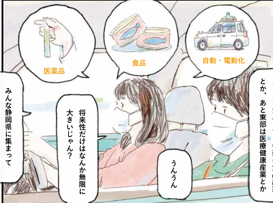
※令和2年の医薬品・医療機器の合計生産金額は11年連続で全国1位