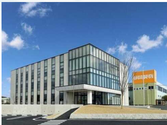
静岡製機株式会社本社屋