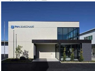
アサヒエンジニアリング 株式会社社屋