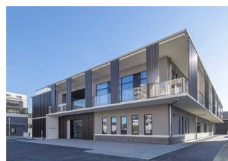
常盤工業株式会社本社事務所棟