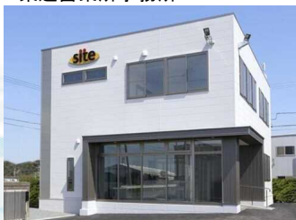
株式会社サイト 東遠営業所事務所