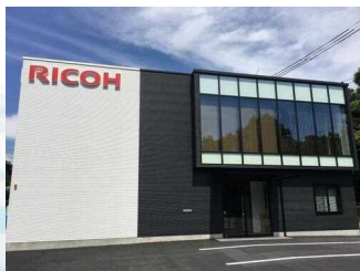
リコージャパン 株式会社掛川事業所