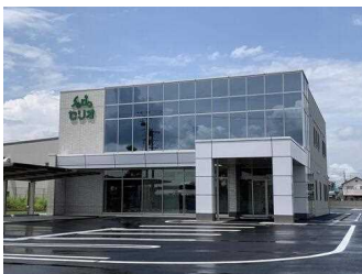
株式会社セリオ本社屋