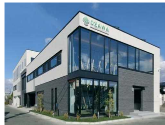
株式会社小澤土木事務所