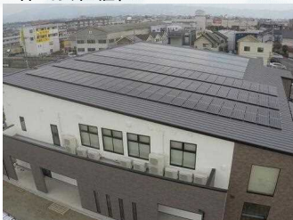
株式会社植松ビル