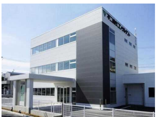
不二総合コンサルタント 株式会社 掛川支店