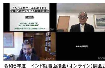
令和5年度 インド就職面接会(オンライン)開会式