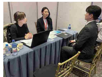
令和5年度 モンゴル就職面接会 面接風景