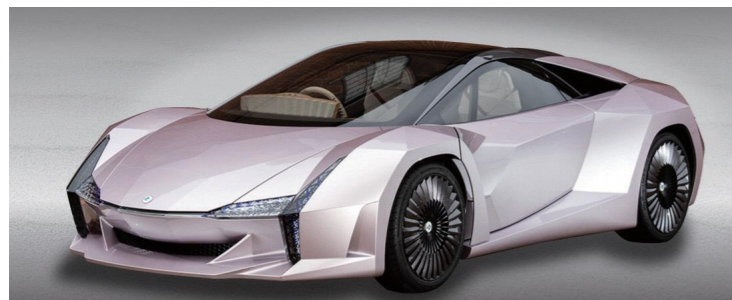
ナノセルロースヴィークル 環境省