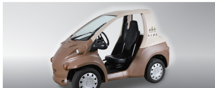
もくまる トヨタ車体株式会社