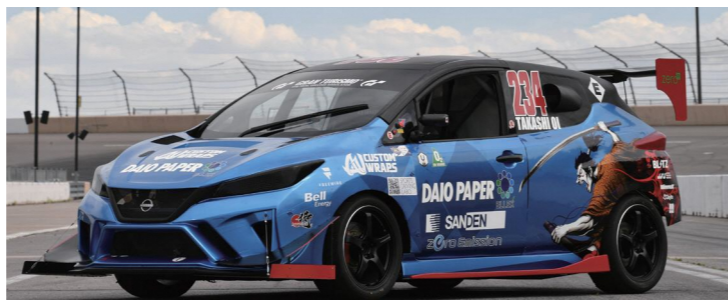
SAMURAI SPEED 大王製紙株式会社