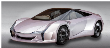
ナノセルロースヴィークル 環境省