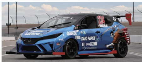
SAMURAI SPEED 大王製紙株式会社