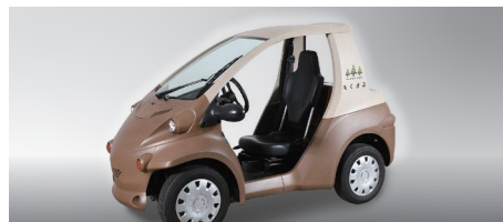
もくまる トヨタ車体株式会社