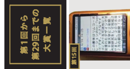
第1回から第29回までの大賞一賞