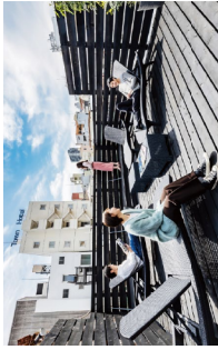
2022年 金賞 じりば

※同一の応募者であっても、コンセプトが異なるものであれば複数応募可能です。 ※他の選定基準やコンペに応募したのも応募可能です。 ※複数人で提案したのも応募可能です。