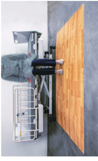
2022年 大賞 ころやわ