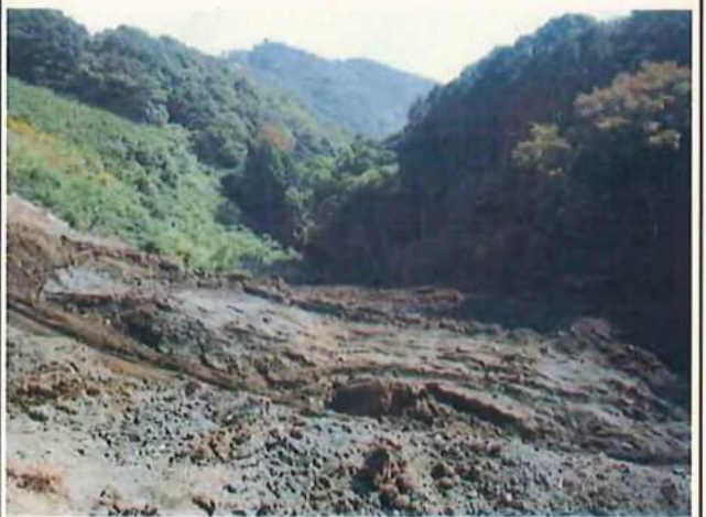
④谷底の埋め立て状況 (大規模な流出は起きていない模様)