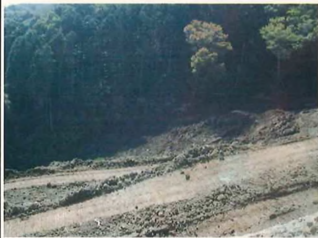
③谷底の埋め立て状況