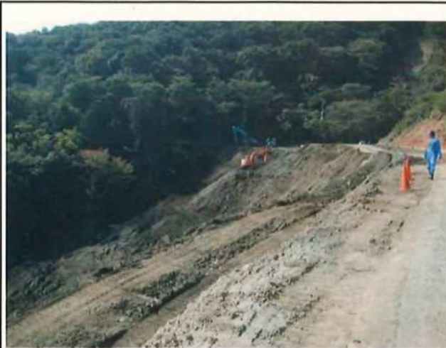
①赤井谷の埋め立て状況

② [redacted] 市役所。 土砂災害防止計画 市役所等。 (伐跡の掘削計画との整合を確保するため 上掲)