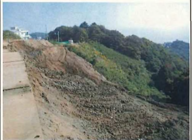
②赤井谷の埋め立て状況(①とは反対側より)