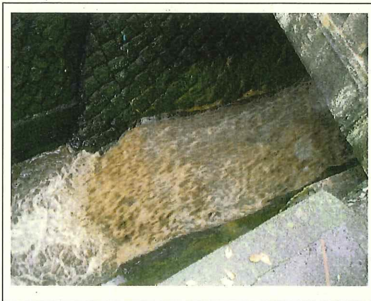
逢初川からの濁流